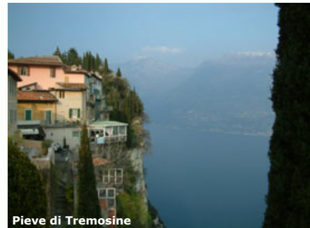
Pieve di Tremosine