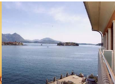
...Sicht aus Ihren Balkon...